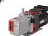
FDU-2110 DUO 6MC PMH-8